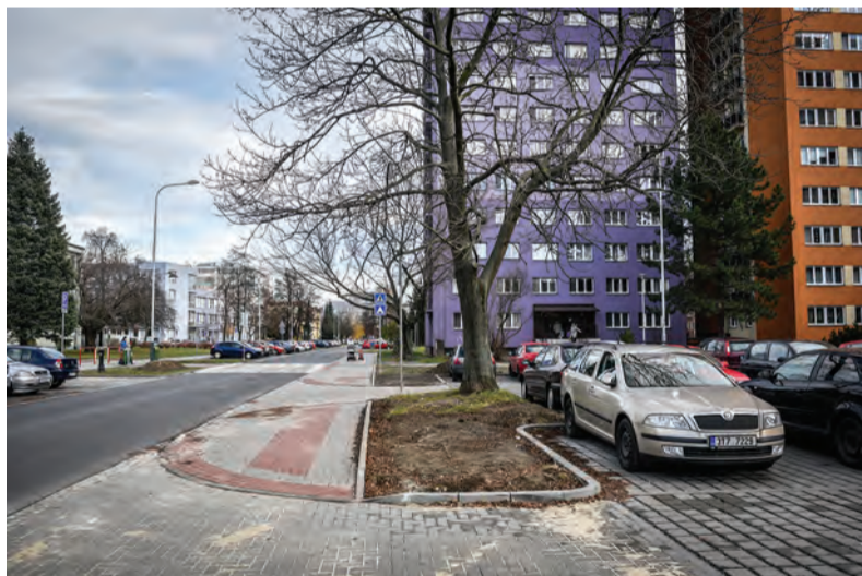
Vedení městského obvodu připravuje podklady pro žádost o dotaci na další etapu regenerace sídliště Šalamouna.

Na příští rok připravená 5.B etapa sídliště Šalamouna se týká prostoru vymezeného ulicemi Zelenou, Na Jízdně, Karolínskou, Dr. Malého a Hornickou