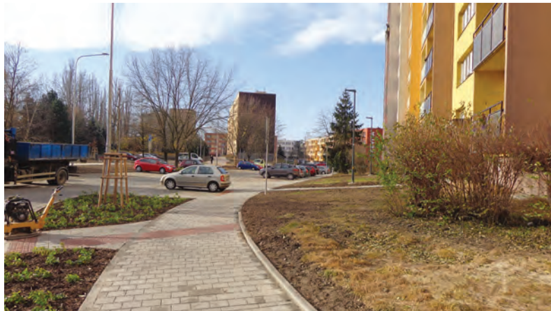
Komplexní rekonstrukce veřejného prostranství sídliště Fifejdy II je u konce.

Chcete mít aktuální přehled o kulturním, sportovním a společenském dění v centru Ostravy? Navštivte nový webový portál s kalendářem akcí konaných v Moravské Ostravě a Přívozu www.kamvcentru.cz !